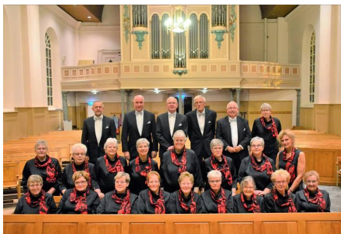
Op de foto ontbreken helaas nogal wat koorleden wegens ziekte.

Op 14 oktober viert het Kerkkoor haar 85 e verjaardag. Al een mensenleven lang heeft het koor haar medewerking verleend aan vele kerkdiensten op vele plaatsen. Wel een leven lang en nog steeds springlevend!