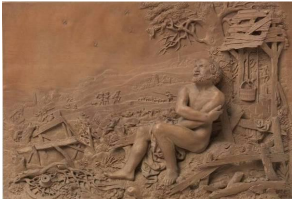
Beeldhouwwerk van Albert Jansz. Vinckenbrinck

Dat is een nieuwe vertaling van Job 42:6. In oudere bijbelvertalingen staat iets anders. Daar lezen we dat Job spijt heeft van alles wat hij over God heeft gezegd. Waar komt dit verschil tussen de vertalingen vandaan?