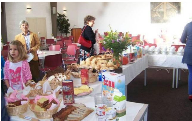
Tot slot enkele foto's van de Startzondag 21 september

Prijs: € 6, -. Vanaf 10 exemplaren: € 5,50; vanaf 50 exemplaren: € 5,00; vanaf 100 exemplaren: € 4,50. Te bestellen via bestellingen@pkn.nl , (030) 880 13 37, of via www.pkn.nl/webwinkel