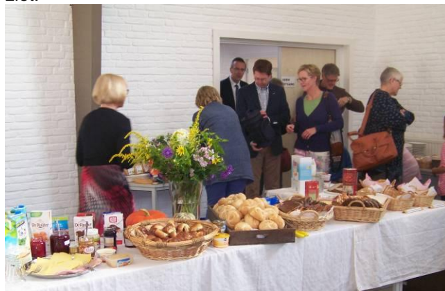
Meer startdag foto's achter in dit blad.....

De ochtend was om 9.00 uur begonnen met een lopend buffet van zelf meegebrachte etenswaren. Enkele broden waren door leden van ZWO gebakken volgens een recept uit Peru vanwege hun project Cepromun. Net als in het Bijbelse verhaal over de vermenigvuldiging van brood en vis bleef er nog genoeg over. Het was een goed en gezellig samenzijn, dat ook enkele mensen trok, die je anders niet zo veel ziet.