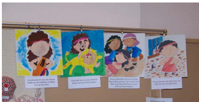
Het verhaal van Simson