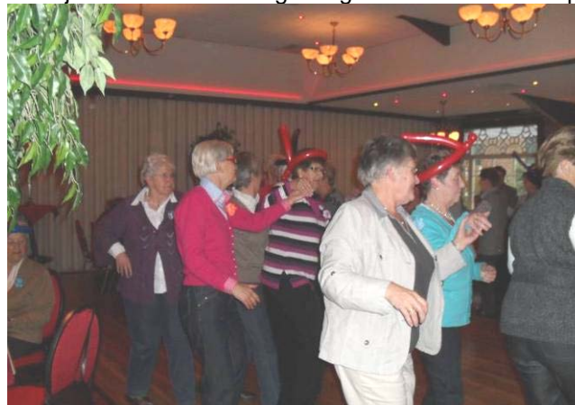
Gezellig samen dansen

Van Stokkum reden we via de Wenninksweg, Voordesdijk en Roosdomsweg terug naar de Haverkamp.