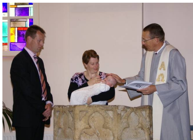
Foto van de doopdienst van 10 mei.

zen vooruit naar het weekend, waarin de folkloristische vereniging en de fanfare hun 75-jarig jubileum vieren. Zeven jaar geleden werd dat gecombineerd met een openluchtdienst bij de Haverkamp. Nu hebben ze gevraagd om deze bijzondere viering in de kerk te houden. Met alle genoegen werken we daar aan mee. Er worden bijdragen verwacht van verschillende dans- en muziekgroepen uit het buitenland (gebeden, liederen, muziek). Een ensemble uit de fanfare begeleidt een deel van de liederen. Wie deze kerkdienst niet wil missen, die wordt aangeraden op tijd te komen in verband met het beperkt aantal zitplaatsen.