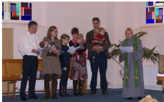
Foto van de doopdienst van 15 november 2009