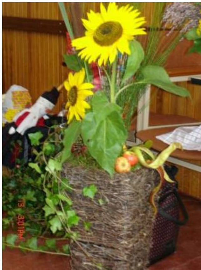
Bloemstuk gemaakt door tuinclub HVV voor Fancyfair