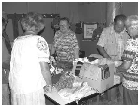
Ook was er natuurlijk weer de verkoop van (poppen) kleding en handwerkspullen en de boekenmarkt.